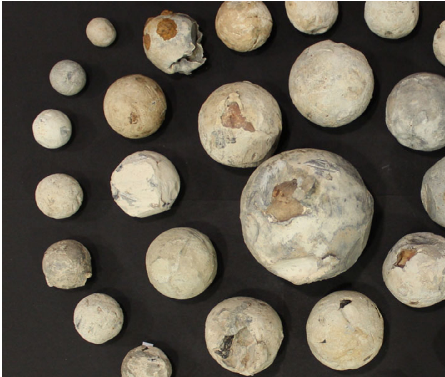
Cannonballs a geir ar safle'r frwydr