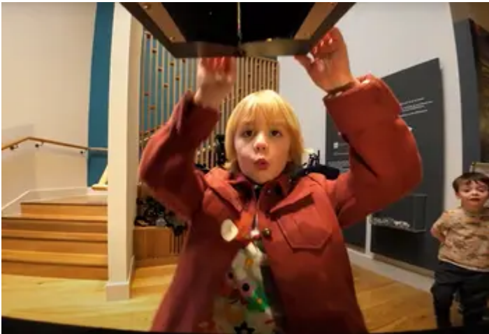
treftadaeth cyn ein penblwydd 30