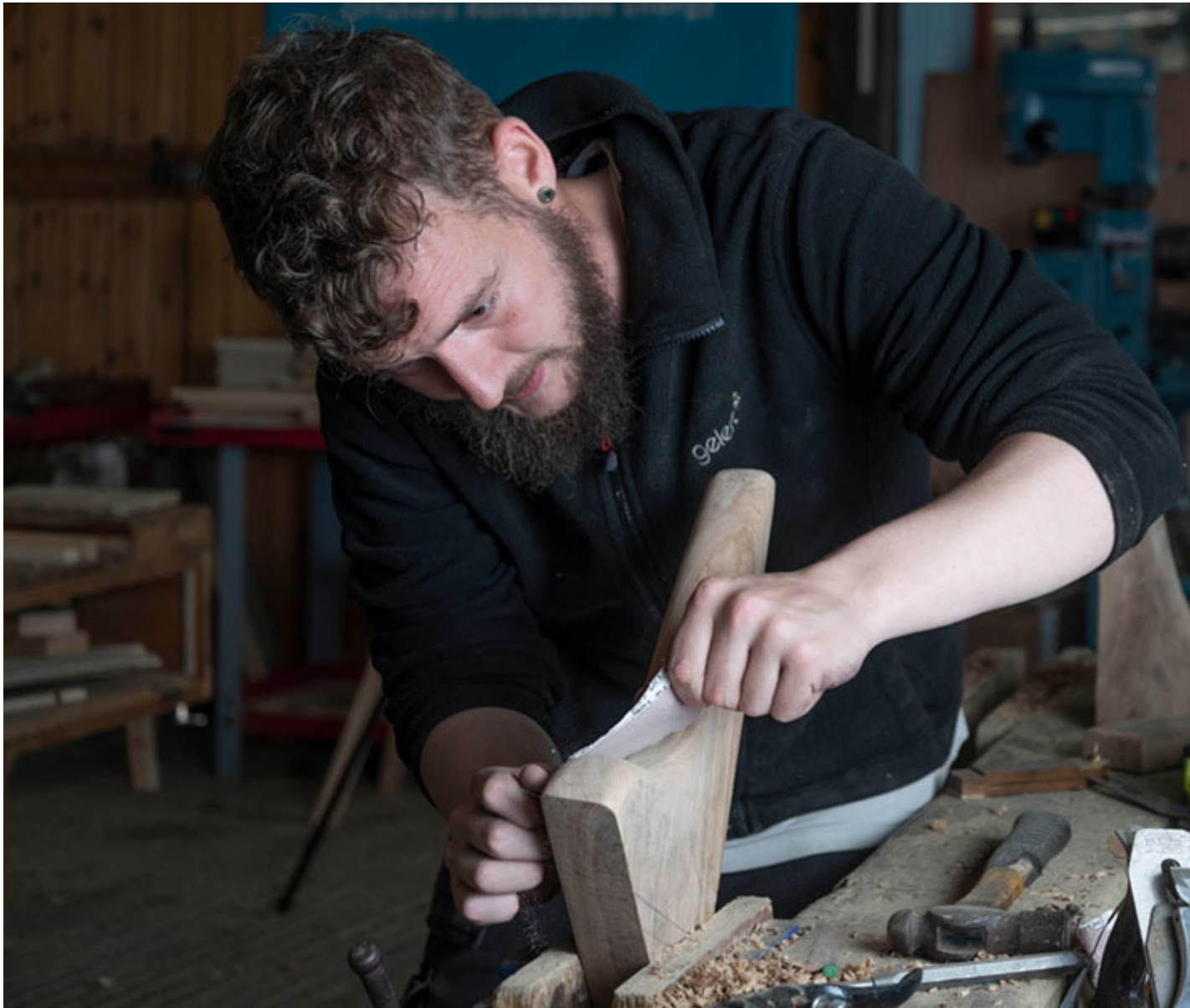
Llun: Colin McLean

Ar un adeg yn ardal a phorthladd adeiladu llongau o bwys, yn fwy diweddar mae Blyth wedi profi lefelau uchel o ddiweithdra. Roedd y prosiect hwn yn targedu pobl ifanc 16-30 oed ac yn rhoi cyfle iddynt ennill cymwysterau galwedigaethol lefel mynediad mewn gweithrediadau peirianeg trwy adeiladu cychod traddodiadol.