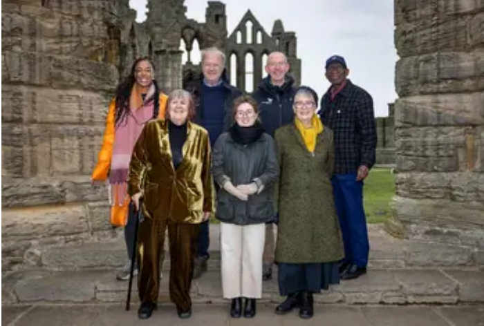
vid y gêm' ar draws treftadaeth, tir a natur