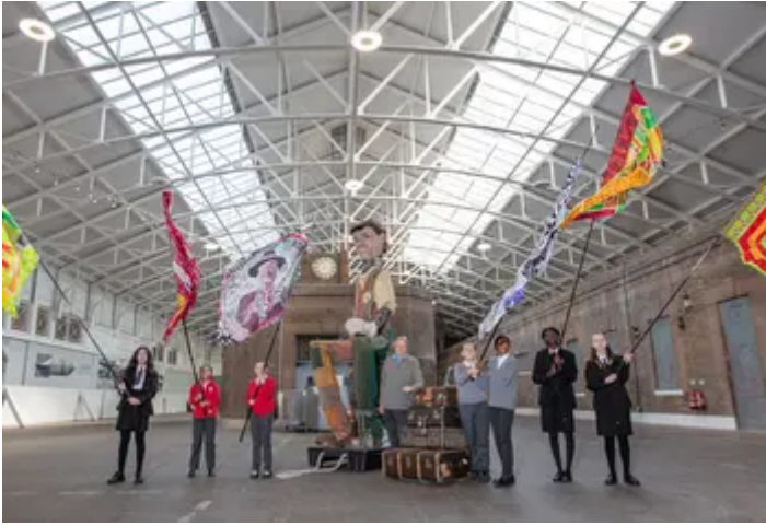
Gorsaf Tilbury Riverside.