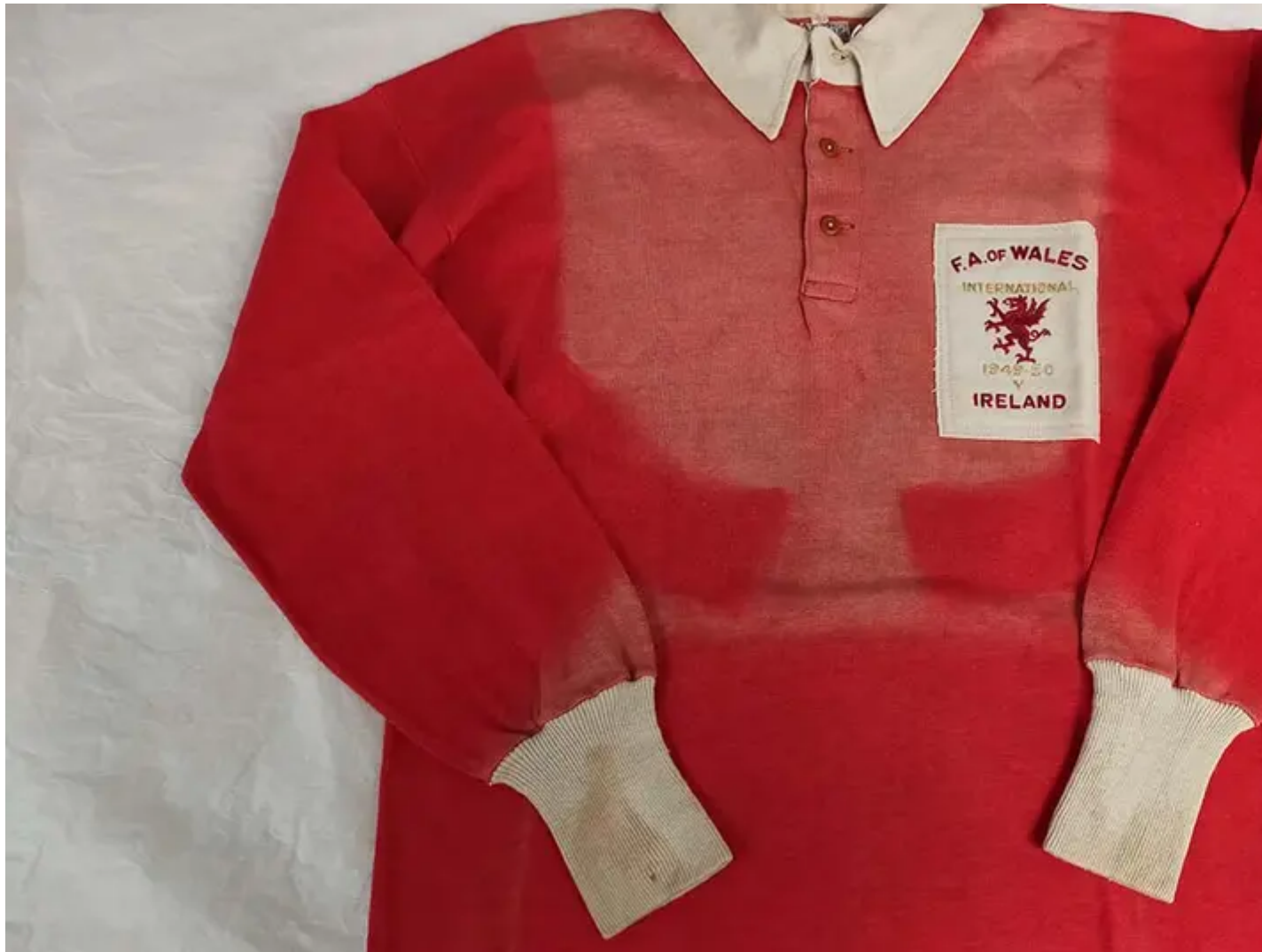
Crys gêm gyntaf John Charles ar gyfer Cymru v Iwerddon 1950.

Bydd Lancashire Cricket Heritage Experience (y dyfarnwyd £176,650 iddo) yn datblygu cynlluniau i ddod â hyb treftadaeth rhyngweithiol i faes criced Emirates Old Trafford. Bydd yr amgueddfa'n cynnwys technoleg drochi, arddangosfeydd rhyngweithiol ac arddangosion ymarferol.