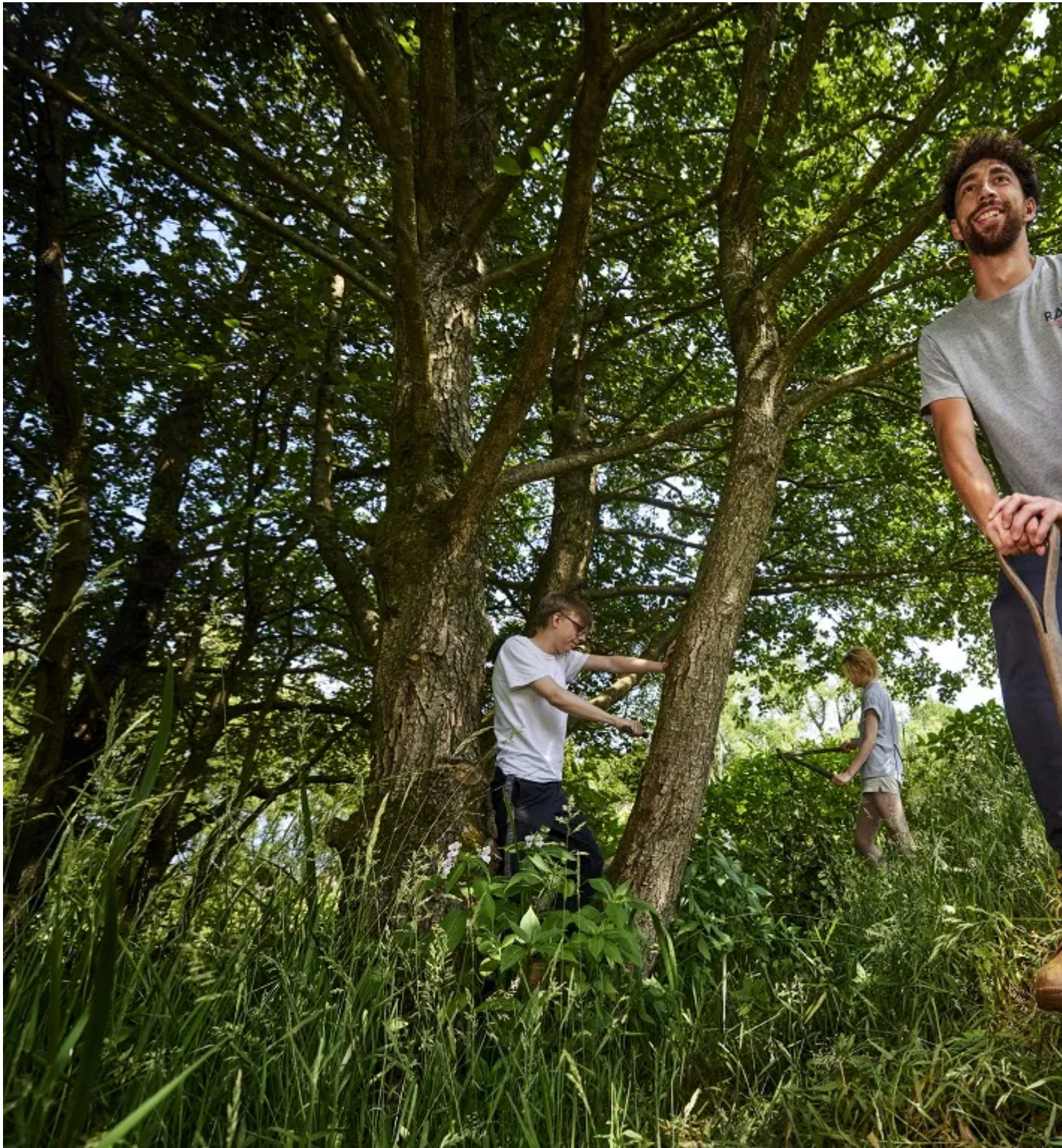
Mae'r rhaglen yn cynnig amrywiaeth o leoliadau sy'n seiliedig ar natur.