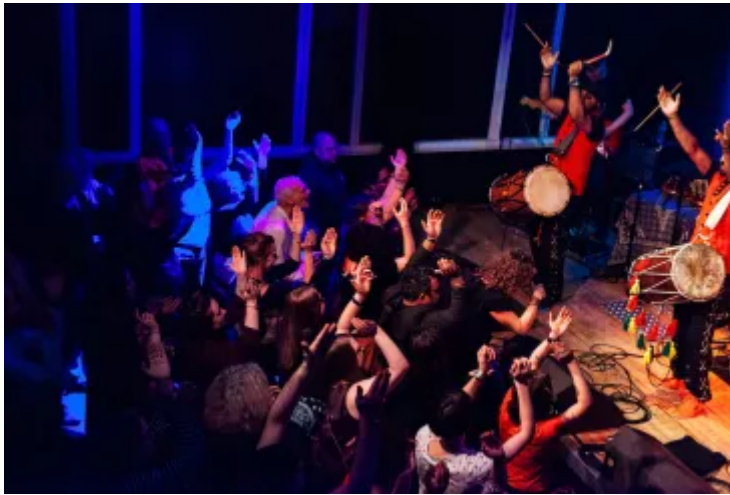
Gig yn Band on the Wall, Manceinion

Mae wedi gwneud gwahaniaeth enfawr i lawer o drysorau treftadaeth y DU – o amgueddfeydd a neuaddau cerddoriaeth i oleudai a llynnoedd.