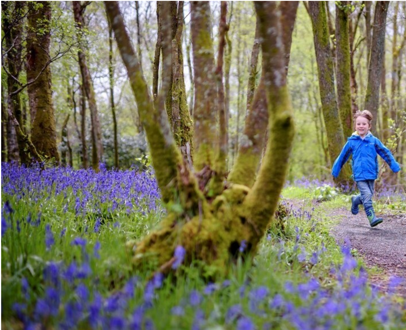
Archwilio natur yn RSPB Loch Leven.