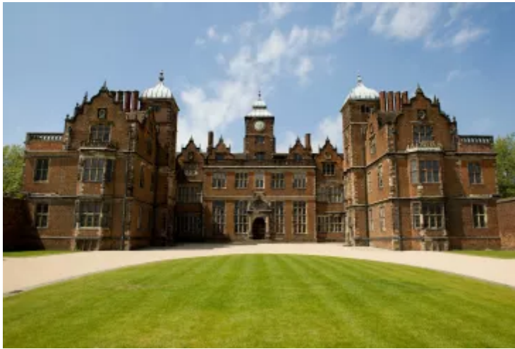
Neuadd Aston yn Birmingham

Archwiliwch dros 30 o ystafelloedd o'r plasty mawreddog hwn, gan gynnwys Siambr y Brenin Siarl, y Grisiau Mawr a'r Oriol Hir anhygoel. Gallwch hefyd goroni'r cyfan gyda thaith gerdded yng Ngardd Lady Holte. Mae 50% oddi ar y mynediad i Neuadd Aston ar gael drwy gydol yr wythnos.