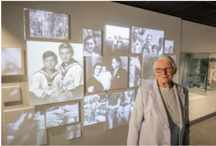
Cadw'r gorffennol yn Arddangosfa'r Holocaust a Chanolfan Ddysgu, Huddersfield

Bydd y ganolfan yn cyflwyno rhai o'i chasgliadau mwyaf prin ar gyfer chwaraewyr y Loteri Genedlaethol. Ewch draw i gwrdd â'r archifydd a darganfod beth mae'n ei olygu i ddiogelu treftadaeth yr Holocaust.