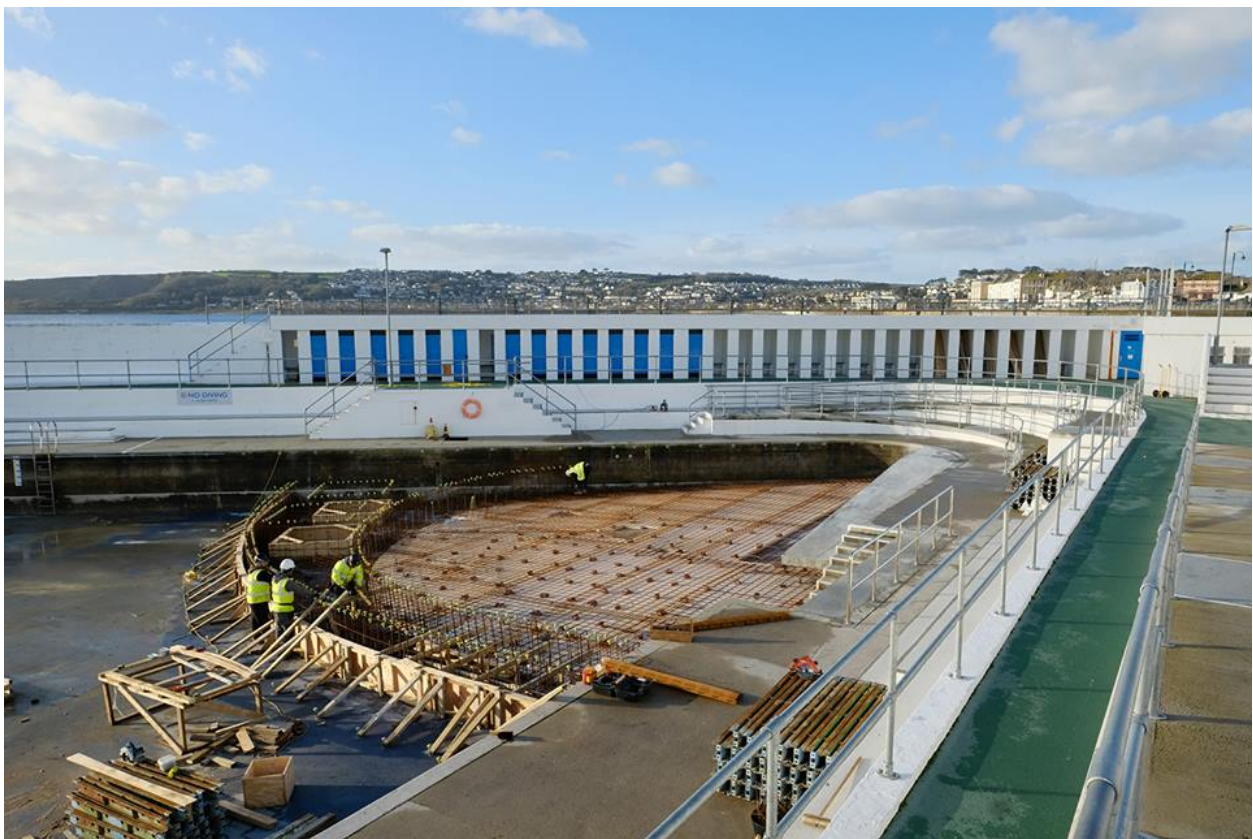
Pwll jiwbilî yn cael ei adeiladu

Hefyd, roedd pobl yn aml yn cael trafferth gyda thymheredd y dŵr oer. Er mwyn cefnogi twf economaidd hirdymor, bu'n rhaid i'r pwll fod ar agor fwy na phedwar mis y flwyddyn a pheidio â bod mor ddibynnol ar y tywydd.