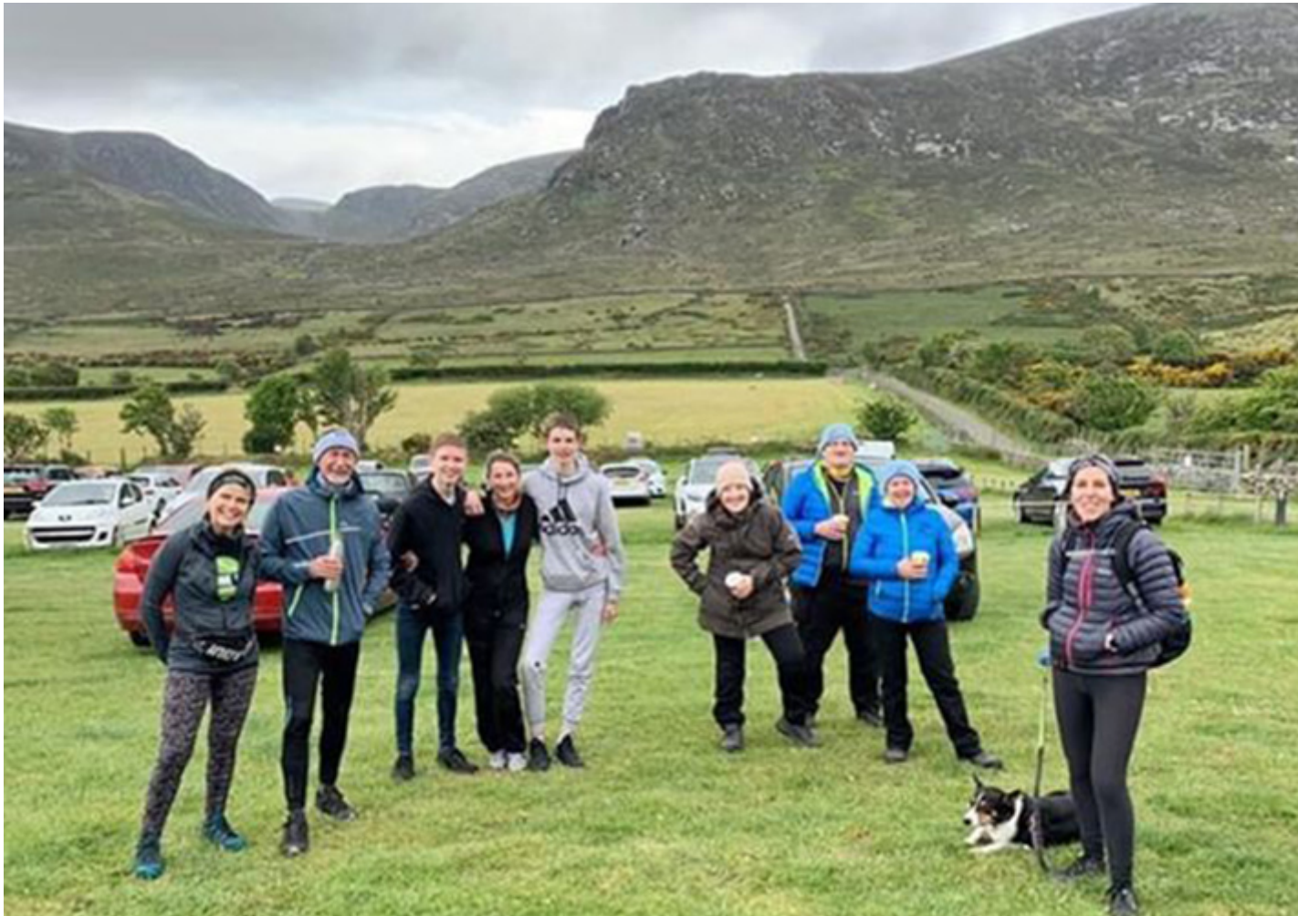
Gwirfoddolwyr treftadaeth Mourne

Dyweddodd dros ddwy ran o dair o'r ymatebwyr eu bod yn gwario o leiaf rhywfaint o'u grant ar fesurau ymbellhau cymdeithasol. Helpodd hyn lawer o sefydliadau treftadaeth i ailagor yn ddiogel, a gwirfoddolwyr i ddychwelyd i'w rolau.