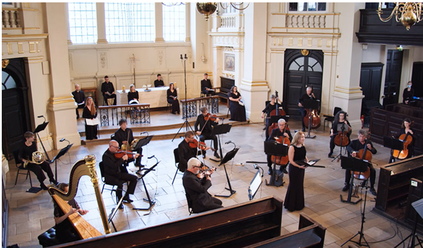
Cyngerdd yn St-Martin-in-the-Fields, Llundain

"Mae'r adroddiad yma'n rhoi cipolwg allweddol ar sut yr effeithiwyd ar dreftadaeth yn ogystal â sut y gallwn ni fel corff ariannu barhau i'w helpu i arloesi ac addasu wrth symud ymlaen."