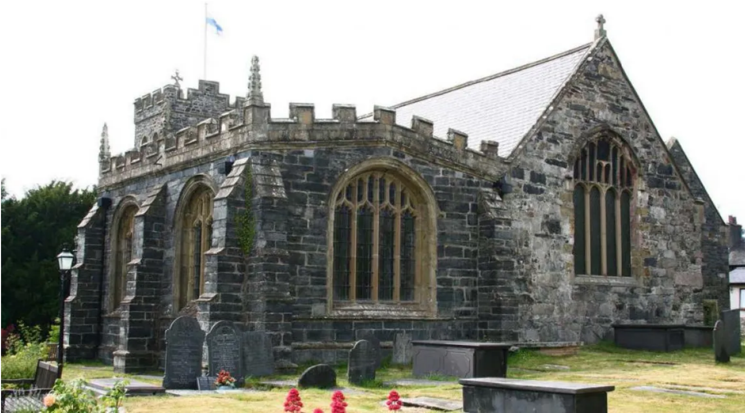
Eglwys St Grwst, Conwy.

Mae adroddiad 2020 yn tynnu sylw at ardaloedd treftadaeth gorau'r DU ac yn cyflwyno'r achos dros dreftadaeth fel ffordd o wella yn sgil pandemig coronafeirws (COVID-19).