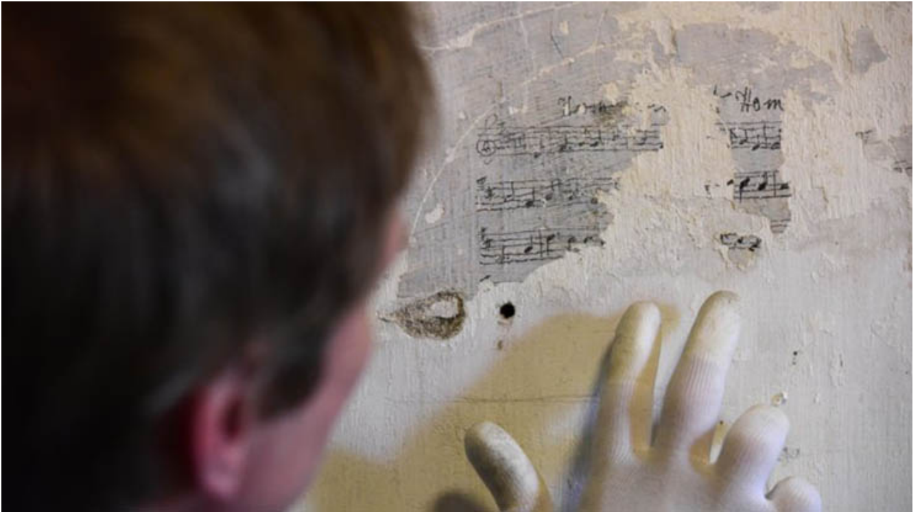
Cafodd prosiect sy'n gwarchod graffiti ym Mloc Cell Castell Richmond arian y Loteri Genedlaethol.

Gweler yr adroddiad am y rhestr lawn ar gyfer pob gwlad yn y DU.