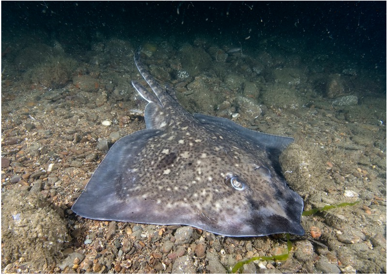
Thornback Ray.