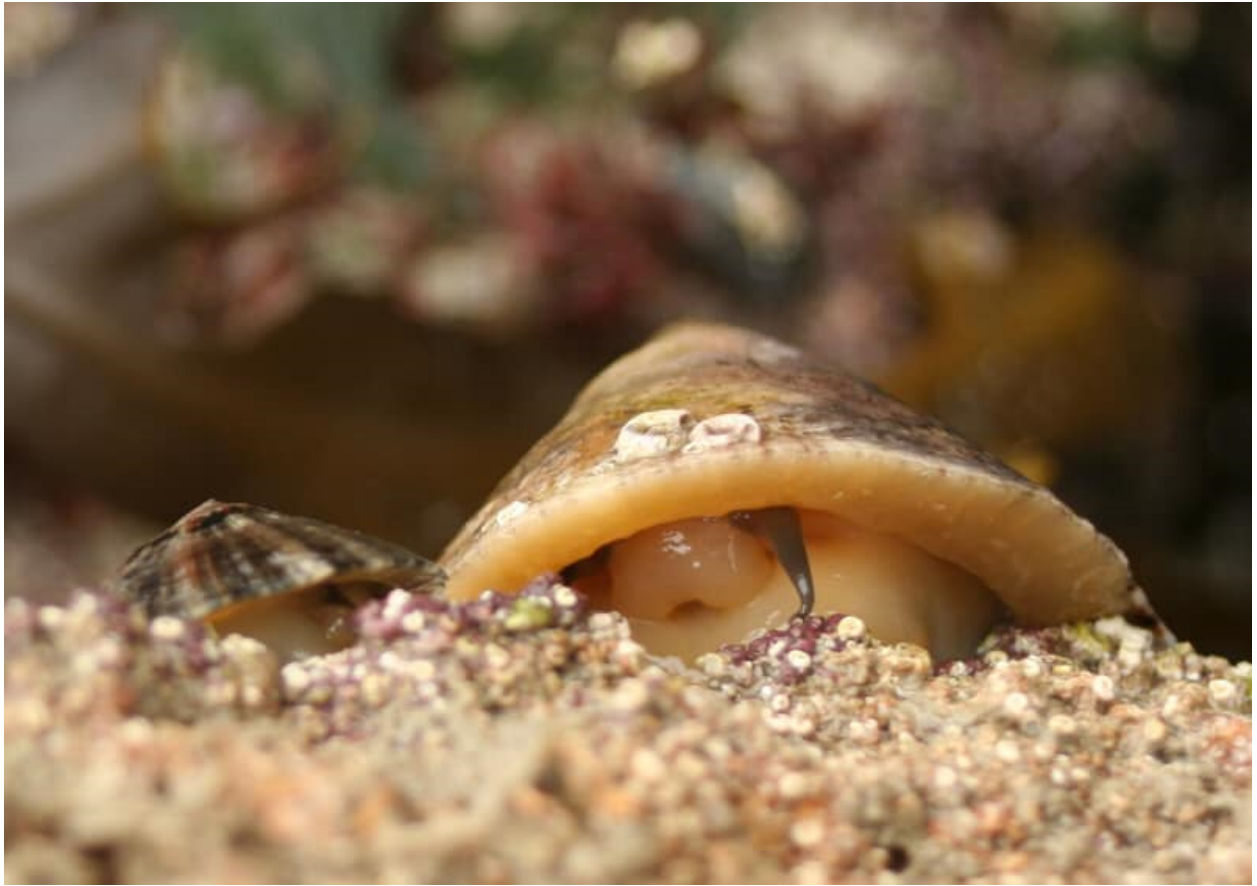
Brennig a molysgiaid eraill.