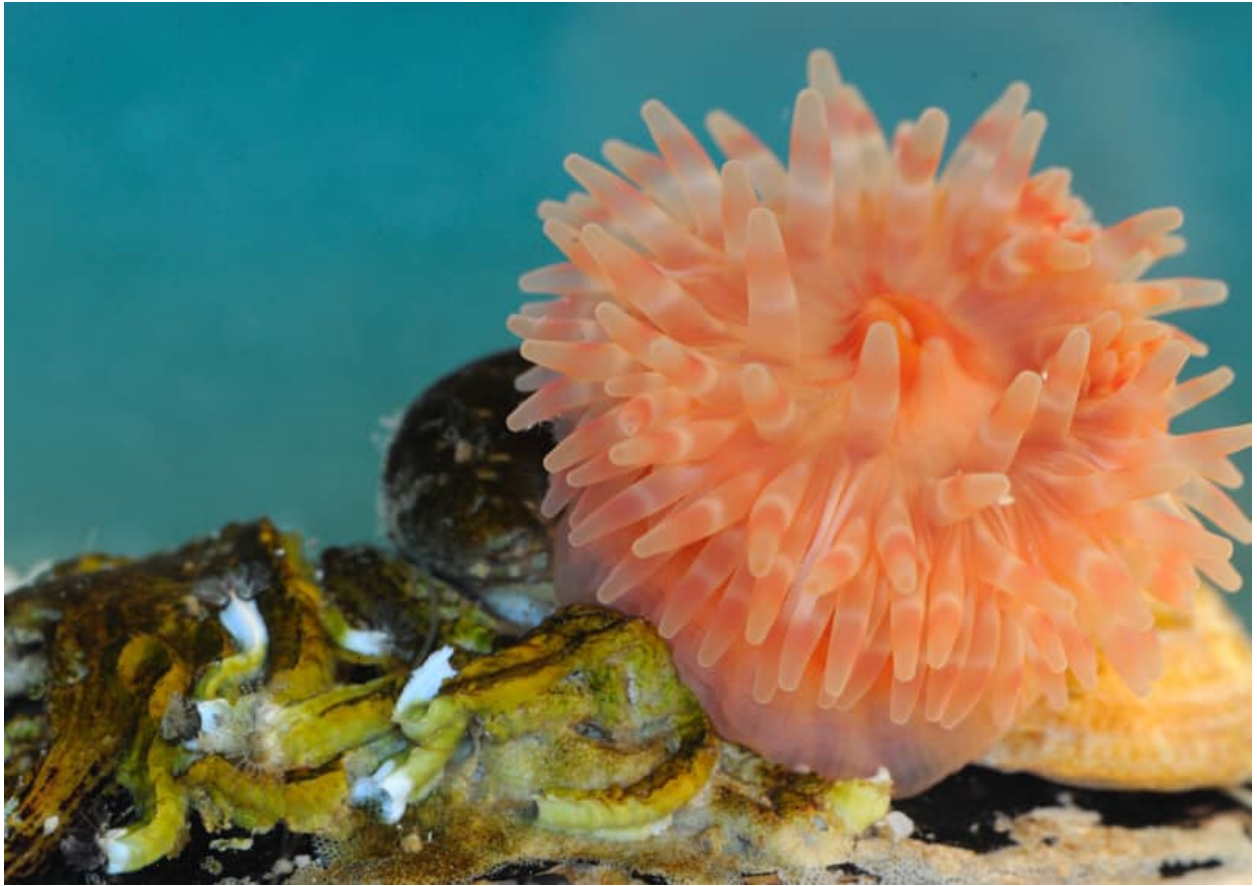
Anemoni'r Môr.